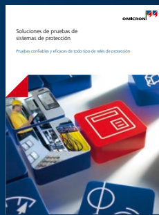
Soluciones de prueba para sistemas de protección

Para obtener más información, documentación adicional e información de contacto detallada de nuestras oficinas en todo el mundo visite nuestro sitio web.