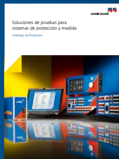
Catálogo del producto (equipo secundario)

Se puede encontrar información adicional acerca de las soluciones descritas en este folleto en las publicaciones siguientes: