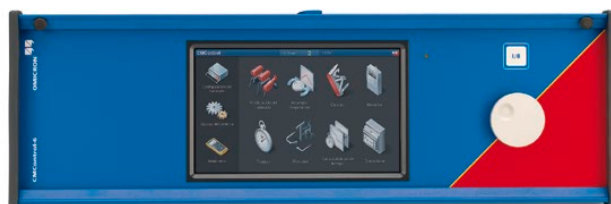
Control de panel frontal CMControl-6 (opción)

Además de operar con el potente software Test Universe desde un PC, el CMC 356 puede controlarse mediante la flexible unidad CMControl , o bien mediante la CMControl App , ejecutada en un PC Windows o en una Tablet Android. Para más información, rogamos visite nuestra web.